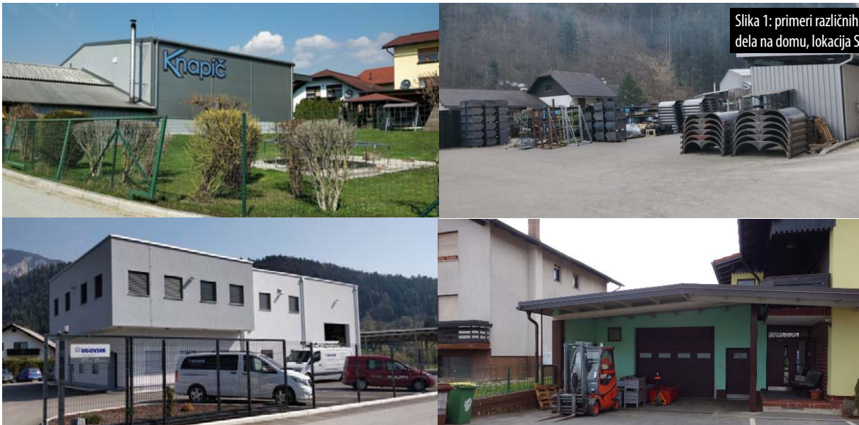
Slika 1: primeri različnih pojavnih oblik dela na domu, lokacija Savinjska regija.