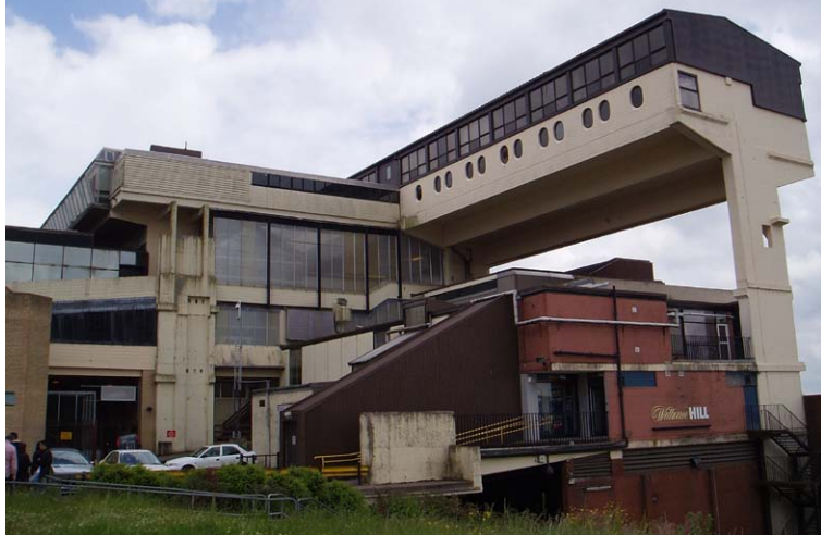
Slika 1: Cumbernauld Glasgow.

Ključna je torej lokacija centralnih dejavnosti. Poleg prostorske lokacije v središču mesta ali na njegovem obrobju, so pomembne tudi stavbe, v katerih so te dejavnosti umeščene. Prav stavbe in njihova lokacija so tisti dejavniki, ki pomembno vplivajo na prisotnost in oblikovanje odprtega javnega prostora. Vse več avtorjev ugotavlja, da se urbani vzorci v sodobnem mestu spreminjajo iz horizontalnih v vertikalne in postajajo bolj tridimenzionalni