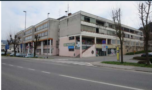
Slika 5 a, 5 b, 5 c: Veliki stavbni kompleksi v Litiji (a - leva slika), Domžalah (b - slika na sredini) in Sevnici (c - slika na desni).